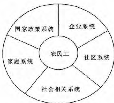
图2 农民工赋权相关系统图

因此,社区为本构筑农民工的赋权体系中,我们以实践社区中所设立的外来工服务中心为平台,从生态视角关注农民工相关的多维群体,主要有农民工自身群体(将其分类进行个性化服务,包括外来务工人员子女、青年外来务工人员、新入城务工人员、女性外来务工人员、失业外来务工人员、贫困外来务工人员等)个体与家庭系统、农民工所在社区系统、社区中的原生居民系统、农民工服务的企业系统、社会相关的环境系统、国家的社会政策系统等。赋权内容上也从多维角度进行设计,包括就业生计、子女教育、心理辅导和健康服务、维权服务、社会交往和社区参与服务、文化生活服务等。这是一个综融性的生态赋权体系,它提供了一个多元层面、多元系统的全人概念架构来理解农民工的社会生活功能。图2具体地展示农民工所处的相互作用和影响的各主要生态系统,这些环境和系统正是社会工作介入与赋权时需要面对和处理。