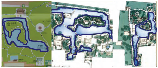
图5 东部一湾清流 图6 中部开阔水域 图7 西部层次丰富水体