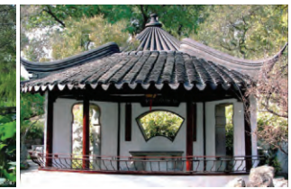
图15 扇亭、笠亭浑然一体