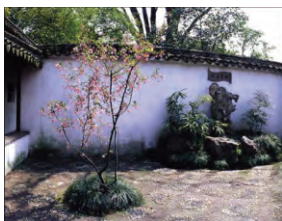
图23 海棠春坞的海棠

拙政园内有文徵明亲手所植紫藤,藤枝悬挂,阳春三月,香花串串,绽放珠光宝气。“玉兰屋前种,美花香气送”的玉兰,表达主人此生当如玉兰洁的高贵品质。“若使海棠根可移,扬州芍药应羞死”,描绘了“花中神仙”海棠的风韵。海棠春坞栽植的西府、垂丝、贴梗,3株海棠造就“一枝气可压千林”,达到“姿色占春荣”的繁荣景象(见图23)。“书后欲题三百颗,洞庭须待满林霜”,创造秋季层林尽染的橘林景象。王安石《梅》“遥知不是雪,为有暗香来”,是对傲雪凌寒梅花的绝妙形容。山茶别名曼陀罗,栽植多株名贵山茶花“十八学士”,得名十八曼陀罗花馆。山茶花是多福多寿之花。枇杷为吴中地产,色黄如金。“东园载酒西园醉,摘尽枇杷一树金”。枇杷园内栽植十几株枇杷树,象征殷实富足,每一果实内含一至数颗坚核,又象征子嗣昌盛 [5] 。“风入寒松声自古”,黑松伴风摇动,松涛作响。《荀子》“松柏有本性,金石见盟心”,借黑松特性,象征主人的坚毅品格,既是自励又是标榜。“清水出芙蓉,天然去雕饰”,“出水涟漪,香远益清,不染偏奇”,“出淤泥而不染,濯清涟而不妖”,“留得残荷听雨声”。荷花是拙政园的精华,作为拙政园的主题形象,从露出圆圆的嫩叶,直到开出娇艳欲滴的花朵,都散发着诱人魅力。即使到了秋塘枯荷也依旧诗意盎然。“听雨入秋竹”,“雨打芭蕉淅沥沥”,宋杨万里《秋雨叹十解》“蕉叶半黄荷叶碧,两家秋雨一家声”,雨中芭蕉增添园林意境(见图24),突显声音之美。“竹径通幽”,“移竹当窗”,“粉墙竹影”是竹在拙政园的造景应用,因竹的高雅、纯洁、虚心、有节、不畏霜雪等特点与中国传统的审美趣味、伦理道德意识契合,被人格化,象征着虚心谦和、高风亮节、坚贞不屈的操作,其笔直凌霄的形态与人格正直在结构特征又相对应。