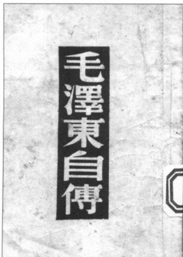
毛泽东自传（重庆梅林书店，1946年1月）

一是重庆梅林书店 1946 年 1 月刊行本，长 17.4 厘米，宽 12.5 厘米，正文 67 页，竖排本。封面为白底，正中有一红色的长条块，上面署有竖行的“毛泽东自传”几个白色大字。全书内容分为六章：少年时代、长沙时代、革命的前奏、国民革命时代、新政权运动、红军之