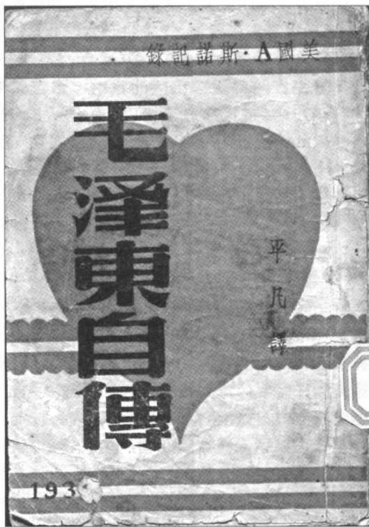
毛泽东自传(上海战时文化书局,1937年12月)