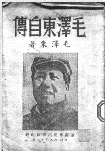
毛泽东自传(重庆市民出版社,出版时间不详)